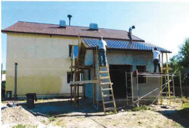
Het ketelhuis in aanbouw...