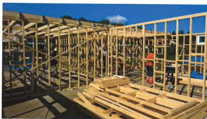
Lekker opschieten onder een strakblauwe lucht...