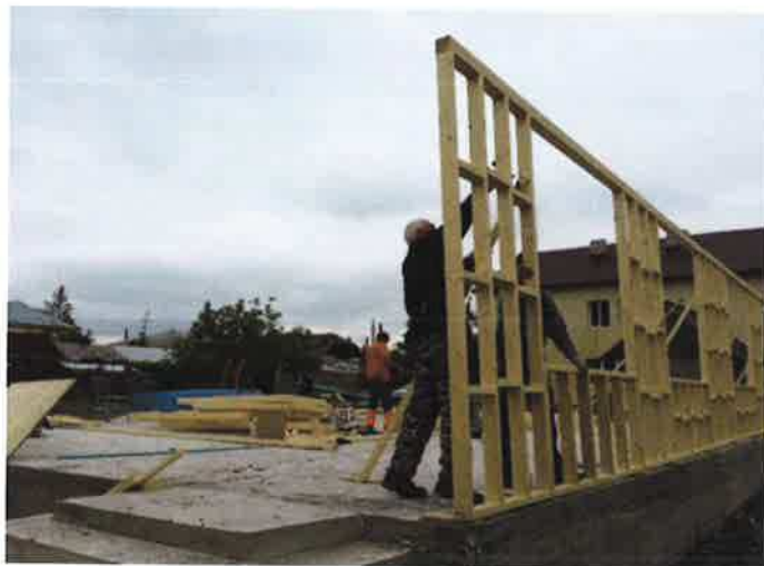
Het eerste wanddeel wordt overeind gezet...

Gedurende de herfst van dat jaar en in de lente van 2016 zijn in de werkplaats totaal ongeveer 1.100 manuren besteed aan de bovengenoemde activiteiten.