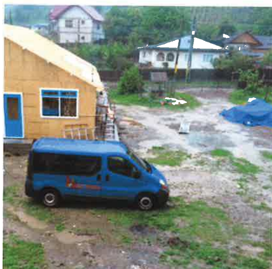
Enkele dagen later een modderpoel...

In het voorjaar van 2016 heeft een Roemeense aannemer het terrein achter de medische post in Plopana bouwrijp gemaakt en de fundering voor het gebouw gelegd. Die was precies op tijd gereed en uitgehard, zodat onze eerste groep vrijwilligers op 16 mei van dat jaar aan de slag kon met de materialen die op dezelfde dag per vrachtwagen op de eindbestemming waren gearriveerd.