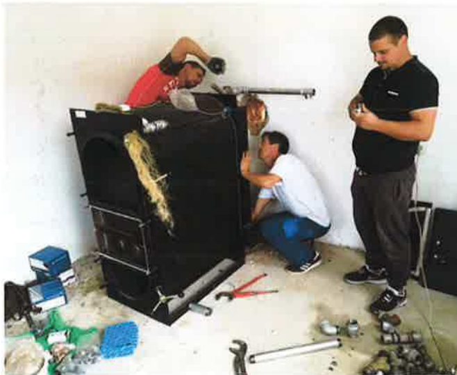
Plaatsing van de houtgestookte ketel...

Deelnemers aan een werkvoorzieningsprogramma werden ingezet, onder andere voor graafwerkzaamheden ten behoeve van de nutsvoorzieningen, maar ook om ons te helpen bij het aanbrengen van de isolatie in het gebouw.