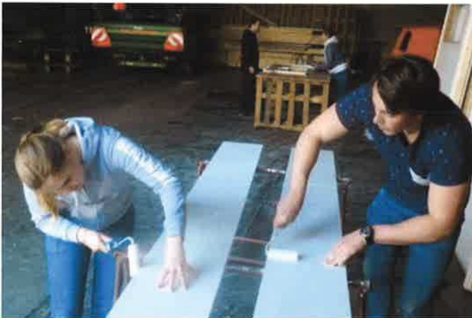
Strak in de (grond)lak...

Tijdens deze fase hebben we wel ervaren dat coördinatie van de beschikbare menskracht, passend bij de uit te voeren werkzaamheden, veel tijd en aandacht vergt.