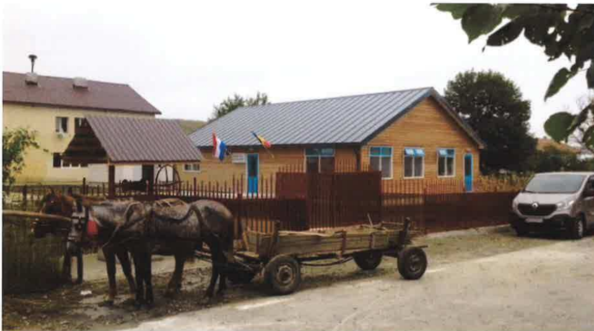
Het splinternieuwe pand in een typisch Plopaans straatbeeld...