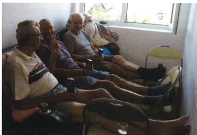
Een welverdiend rustmoment...

We blijven kritisch in onze afwegingen bij het kopen van bouwmaterialen in het projectland, of aanschaf in Nederland. Waar de bedrijfszekerheid en veiligheid van een installatie (elektrisch, centrale verwarming) van groot belang is, kiezen we in de eerste plaats voor kwaliteit.